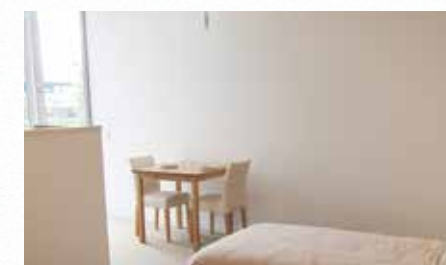
太陽の光が差し込む明るい室内