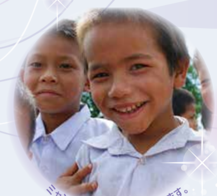
ニャンマーに学校を建設しています。

役目を終えた撤去冠を寄付してください。 たくさん子どもたちを救うことができます。