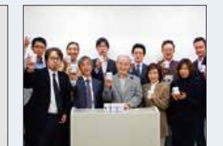
歯科医師会全体でも参加していただいています