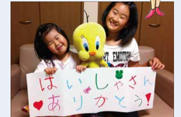
子どもたちから、たくさんの「ありがとう」が届いています！