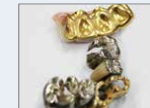
子どもたちを救う撤去冠