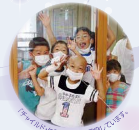
「チャイルド・ケモ・ハウス」を建設しています。