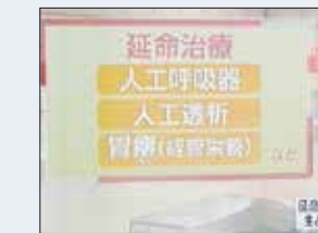
NHKで紹介もされました