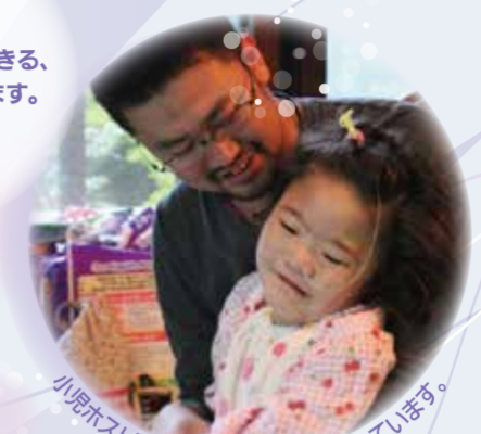
小児ホスピス「海のみえる森」を建設しています。