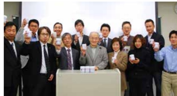
京都府中京歯科医師会 2010年11月26日全体会議にて

患者様のご厚意でいただいた撤去金属を回収BOXに入れて、TOOTH FAIRYにお送りください。お電話いただければ、宅配便が回収BOXの集荷に伺い、着払いでお預かりします。送料は一切かかりません。少量でも結構です。年末の恒例に!