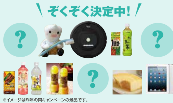
※イメージは昨年の同キャンペーンの景品です。

2013年12月1日から2014年1月15日までの間に、金属をご送付くださった方の中から、抽選でプレゼントが当たります。プレゼントの景品は、TOOTH FAIRYの活動にご賛同いただいた企業様・団体様などから無償でご提供いただいた景品です。