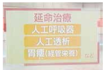
NHK・長崎テレビでも紹介されました