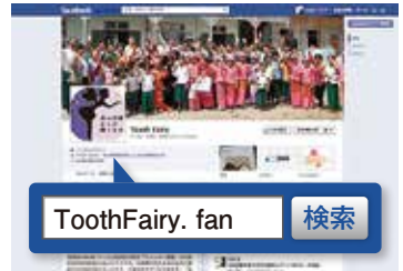
Facebookでも情報公開中! 「いいね!」を押して応援してください