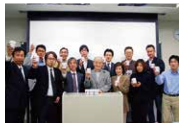
歯科医師会全体でもご入会いただいています(京都府中京歯科医師会の皆様)

参加ポスターのご希望サイズにチェックを付けてください。 A2(59.4cm×42cm) A3(42cm×29.7cm) A4(29.7cm×21cm) 医院名・住所などを、日本財団のホームページなどで紹介し、顕彰いたします。公開を望まない場合は にチェックを付けてください。 HPでの公開を望まない