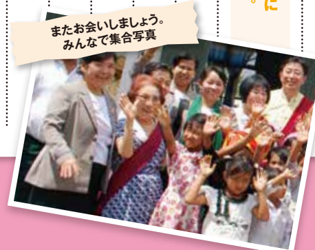
またお会いしましょう。みんなで集合写真