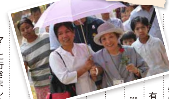
村の人に迎えられ学校へ

今回のツアーに参加したきっかけを教えてください。私の主人は、太平洋戦争の中でも、多くの犠牲者を出したことで有名なインパール作戦に参加して、日本に帰ってこられたことは奇跡でした。15年前に、主人と一緒にミャンマーに行きましたが、その主人も亡くなりました。私の最後の旅として、もう一度、主人が過ごしたミャンマーを訪れたいと思いました。