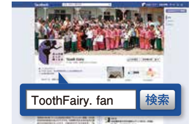
Facebookでも情報公開中! 「いいね!」を押して応援してください