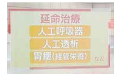
NHK・長崎テレビでも紹介されました