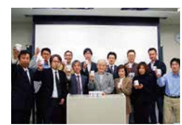
歯科医師会全体でもご入会いただいています(京都府中京歯科医師会の皆様)