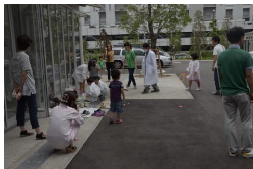
大きなシャボン玉を作る実験教室

プレイルームにて、ANAの皆様による模擬フライト。子ども達はパイロットやキャビンアテンダントの方々とふれあい、また操縦の体験もしました。