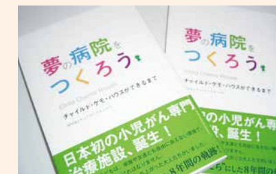
ポプラ社出版「夢の病院をつくろう」

109ページ～110ページに TOOTH FAIRYに関する記載 がございます。