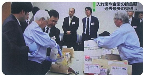
入れ歯や金歯の換金額 過去最多の見直し