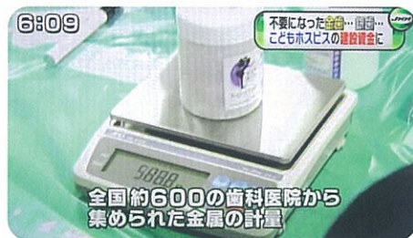
不要になった歯...歯... こどもホスピスの建設資金に