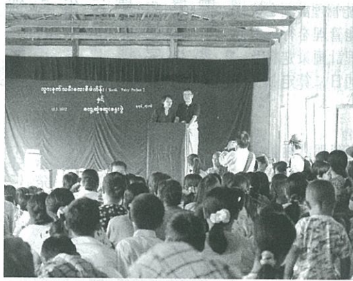
日歯の社会貢献事業を説明

2009年6月、日本歯科医師会は、国内外で幅広い社会貢献活動を展開している日本財団(笹川陽平会長)との間で、歯科撤去物に係るプロジェクト「TOOTH FAIRYプロジェクト」(以下、プロジェクト)について覚書を取り交わし、会員が患者さんの協力を得て受領した歯科撤去物を換金して寄付金として受け入れ、アジアの中でも少数民族が住む僻地の学校建設や国内の小児がん治療の支援などに役立てる事業に協賛している。4月9日現在、本プロジェクトに参加している歯科医院数は4159件、換金総額は3億2千8百万円余に及ぶ。