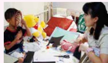
小児がん専用化学療法ハウス

小児がん専用化学療法ハウス設立、夢のキャンプ開催、難病児とその家族へ夢の旅をプレゼント