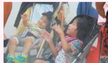
夢の家族旅行をプレゼント