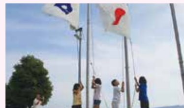
夢のキャンプ開催