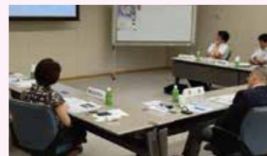
実務者ネットワーク会議