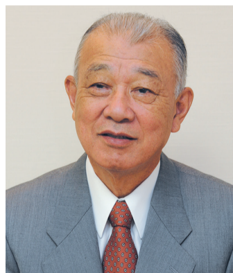
公益財団法人 日本財団 会長 笹川 陽平

日本歯科医師会が協力し、日本財団が主体となって実施している社会貢献活動「TOOTH FAIRYプロジェクト」は、これまで、難病や障がいを抱える子どもたちとその家族を支援し、安らぎや休息などを提供する事業や、ミャンマーでの学校建設事業等の支援活動を展開してきました。より多くの歯科医療機関に参画いただき、今後とも本活動が歯科界の果たすべき役割のひとつとしてさらに発展を続け、少しでも多くの支援等につながることを心より祈念しております。