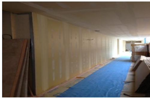
「チャイケモ「すごろく」」 を設置する壁