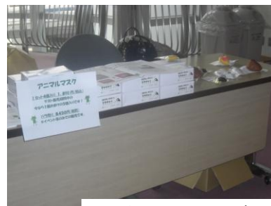
アニマルマスクの販売も しました。