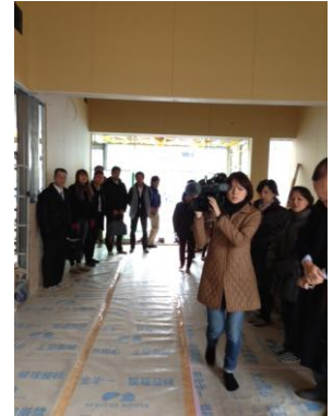
取材も受けました