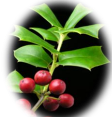
チャイニースホーリー