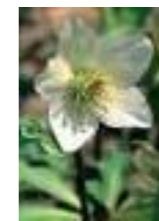
クリスマスローズ