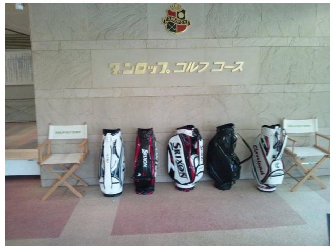
ダンロップゴルフコースにて、チャリティゴルフを実施していただきました!