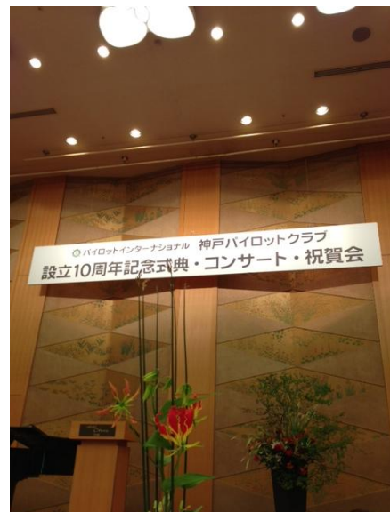
神戸パイロットクラブ設立10周年記念祝賀会にてご寄付をいただきました。