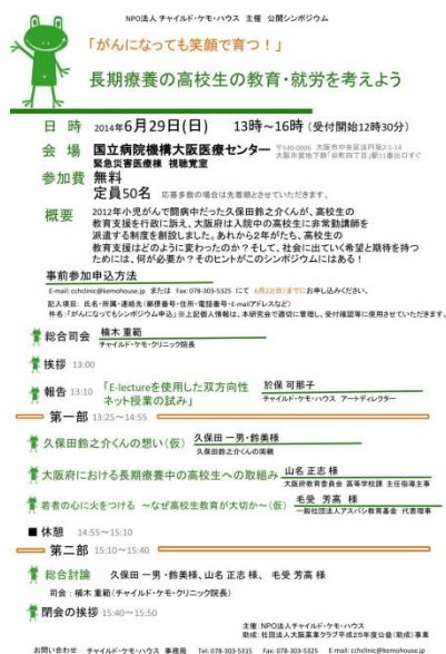
6/29「長期療養の高校生の教育・就労を考えよう!」を実施致します!